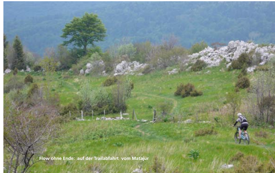
Flow ohne Ende: auf der Trailabfahrt vom Matajur