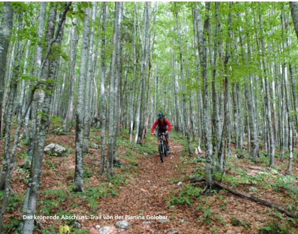
Der krönende Abschluss: Trail von der Planina Golobar