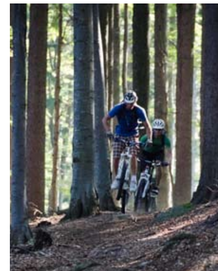
Zum Abheben schön: Einer der zahlreichen Trails

Nach einer kurzen Sightseeingtour verlassen wir am späten Vormittag das Zentrum Ljubljanas durch den Stadtpark. Ein erster kurzer Anstieg mit anschließender Trailabfahrt führt uns in die westlichen Vororte. Von hier aus gelangen wir über die Hügel bei Topol auf kleinen Nebenstraßen und Trails in die historische Altstadt von Škofia Loka. Von dem ehemaligen Sitz der Freisinger Bischöfe machen wir uns auf zu unserer nächsten Unterkunft. Auf einer kleinen Asphaltstraße gelangen wir zu dem idyllisch auf 860 m gelegenen Bauernhof wo wir wieder einmal in den Ge-