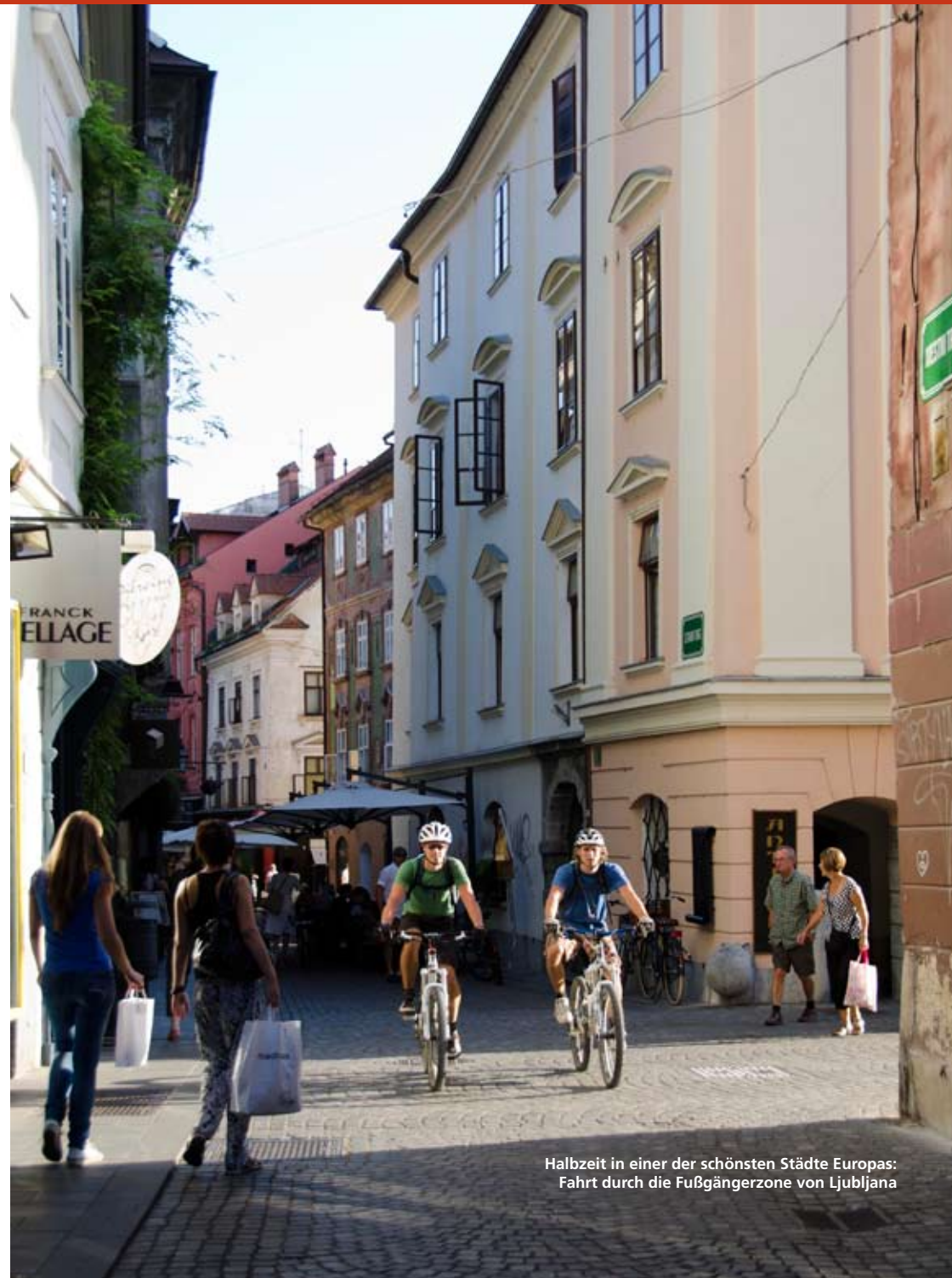
Halbzeit in einer der schönsten Städte Europas: Fahrt durch die Fußgängerzone von Ljubljana

Der Tag beginnt mit einer idyllischen Fahrt entlang des Flusses Idrija. Über eine Schotterstraße bewältigen wir im Anschluss die erste Auf-